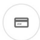
LETTORI DI BADGE

Vuoi vedere in tempo reale i presenti e gli assenti? SOMEtime si interfaccia a pieno col nostro modulo per lo scarico dei dati real time!