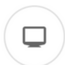
TIMBRARE DAL PC

La soluzione completa per gestire e calcolare le presenze dei dipendenti nelle piccole imprese italiane che integra tutte le funzioni necessarie in un unico ambiente e si interfaccia con tutte le nostre soluzioni per timbrare. SOMEtime si adatta alle realtà dinamiche con gestione anche complessa di dipendenti di vario tipo (full time, part time, lavoratori occasionali o stagionali, cantieri, ecc...).